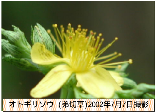
オトギリソウ (弟切草)2002年7月7日撮影

6月28日から7月8日にかけての「西日本豪雨」では高知県馬路村の1852mを筆頭に中国地方でも500mを超え、27日現在、死者219名となつています。広島市他の土砂崩れや、岡山県倉敷市真備町の河川反乱