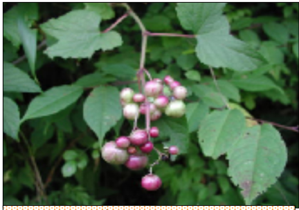
ノブドウ (野葡萄) 2003年7月31日撮影

救う除蓋障地蔵、天道を救う日光地蔵が衆生救済のために配されているのです。また、延命・宝処・宝手・持地・宝印手・堅固意の六地蔵とする説もあるようです。